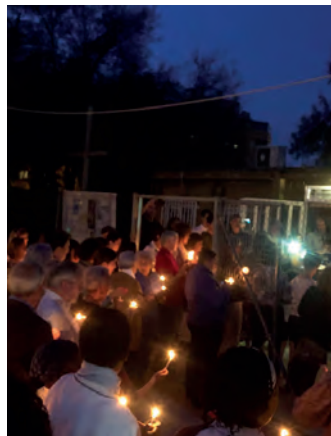
Inicio de la marcha de la luz en la Vigilia.