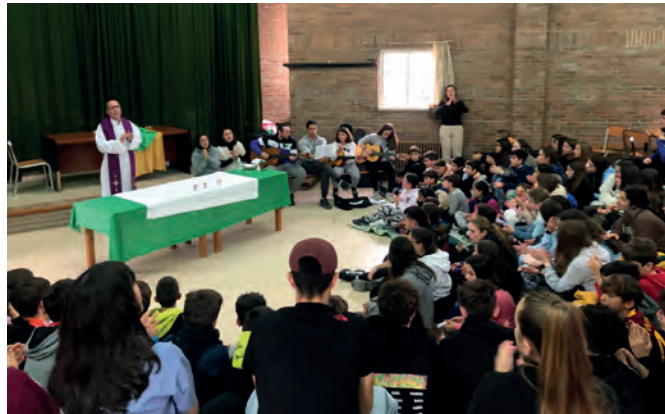
Celebrando la eucarist3a en una de las convivencias del a3o.