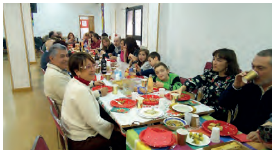
Comida de Navidad a la que fuimos invitados por la Iglesia Evangélica de la Resurrección de la calle Austria.