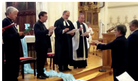
El 16 de septiembre celebramos la Oración por el cuidado de la creación. Nos unimos en la oración y en la fraternidad las iglesias Evangélicas, ortodoxas y católicas de Madrid.