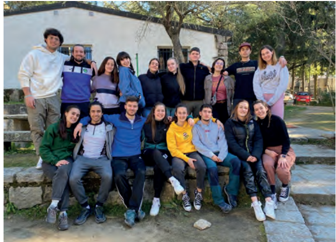
Los educas de Postco en la convivencia y encuentro de programaci3n.

A todos se nos escapa una lagrimita pensando en que se acaba, pero nos alegra el coraz3n saber que la postcomuni3n deja tantas huellas en tantos corazones.