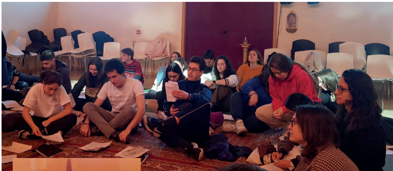
Espacio de silencio y oración en la pascua joven.