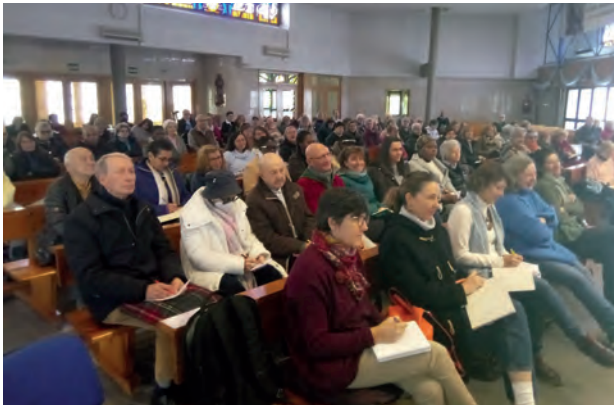
El retiro de adviento junto con parroquias de nuestra zona de San Blas, nos ayudó a cultivar la espera.