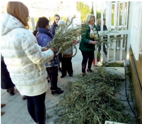
Domingo de Ramos preparando la procesión y bendición