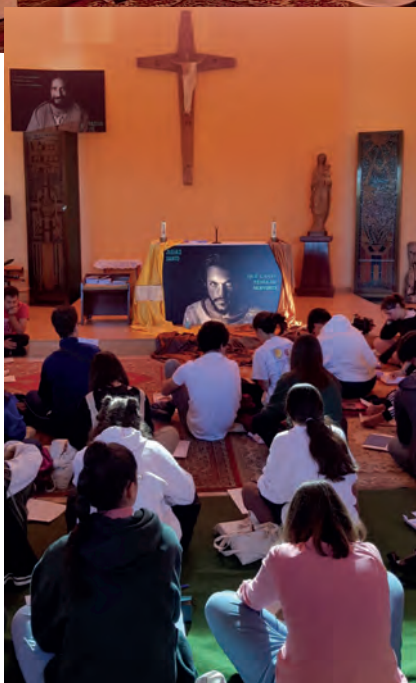
Celebración de la Cena del señor el Jueves Santo.