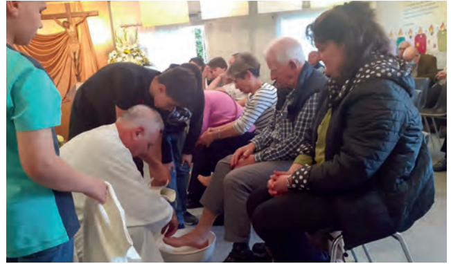
El jueves Santo, en el Lavatorio de los pies recordamos la servicialidad de Jesús.