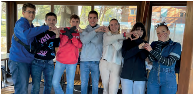
Con juegos y diversión también creamos lazos de fraternidad.