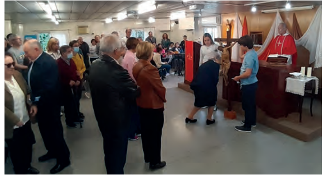
Momento de la Adoración de la Cruz el Viernes Santo.