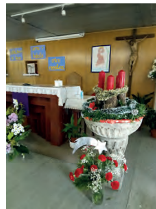
La corona de Adviento que nos ha ido iluminando todo este tiempo de espera.