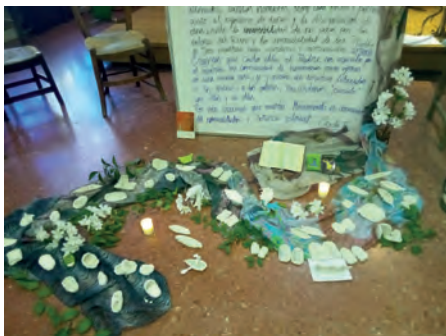
Momento y dinámica de oración y compartir en la capilla.