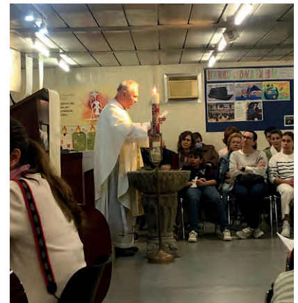
Renovación del bautismo en la Vigilia Pascual.