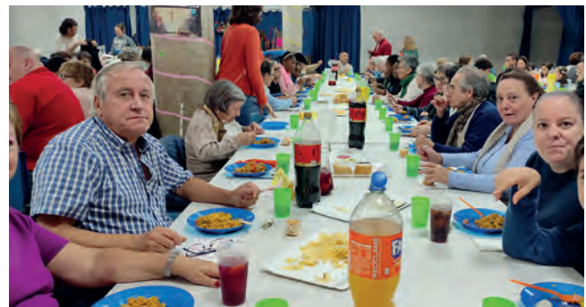
Coincidimos de todas las edades, pequeños, jóvenes y adultos.