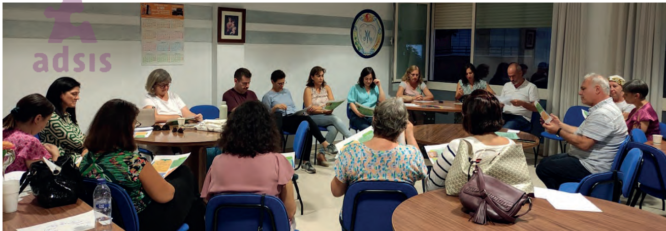
Encuentro de los Hermanos, Asociados, Amigos Adsis para conocernos más y planificar el curso.

Este verano nos juntamos los hermanos y Asociados de las tres comunidades de Madrid en el cursillo de comunidad para tener unos días de oración y de descanso en Los negrales. Terminamos con la eucaristía celebrando a la vida vivida en este curso.