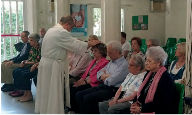
Unción de los enfermos en la comunidad. Celebración gozosa en el tiempo pascual.