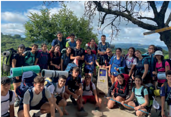
Convivencia de jóvenes de las parroquias de Salamanca, Valladolid y Madrid.