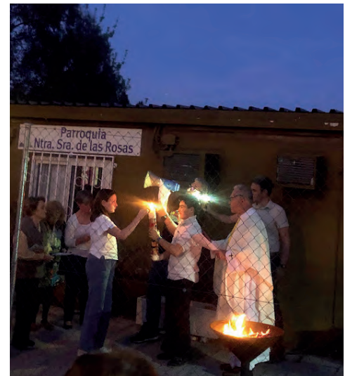
Liturgia del fuego y la luz en la Vigilia pascual.

Con ilusión celebramos la festividad de San Isidro . ■