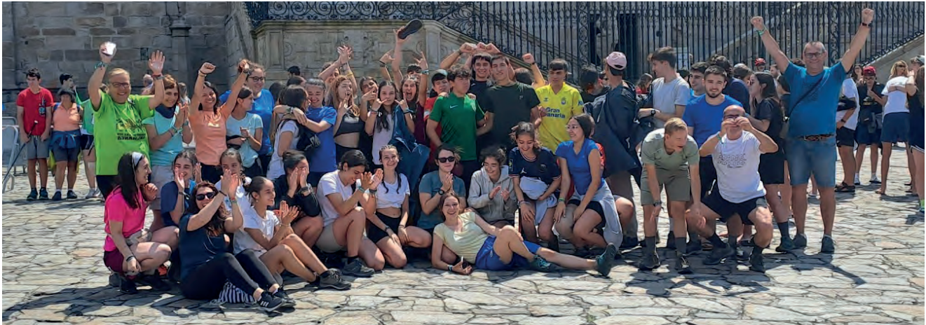
Satisfechos y cansados llegando a Santiago después de un largo peregrinar.