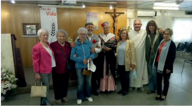
Celebrando el día de San Isidro nuestro patrón.