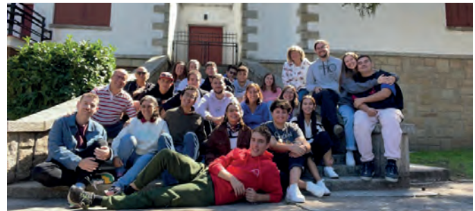
El Equipo de Acompañantes de jóvenes en la convivencia de formación y planificación.