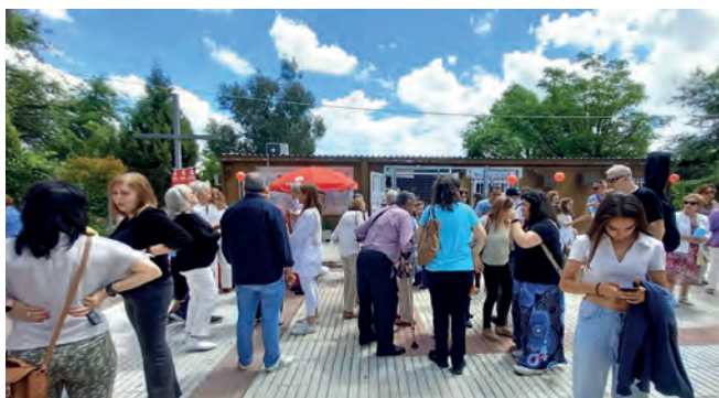
Día del Corpus a la entrada de la Parroquia.