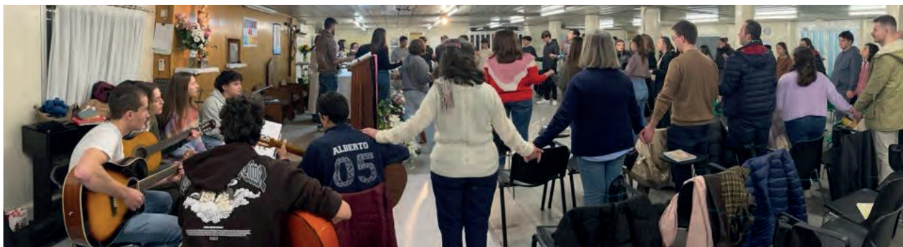
Todos los grupos alrededor del pesebre celebrando la esperanza profética de la Navidad.