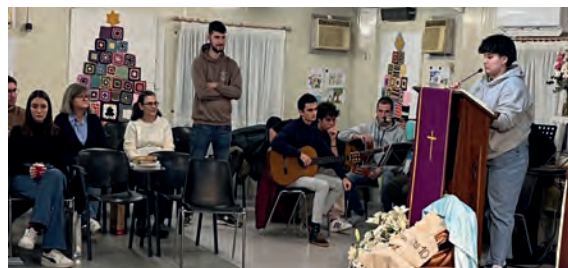
Los jóvenes preparando la celebración de Navidad.