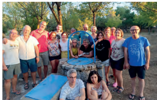
Las tres comunidades en el Cursillo de renovación este verano

A final de curso tuvimos una oración en la casa de comunidad y una merienda compartida de la que disfrutamos todos.