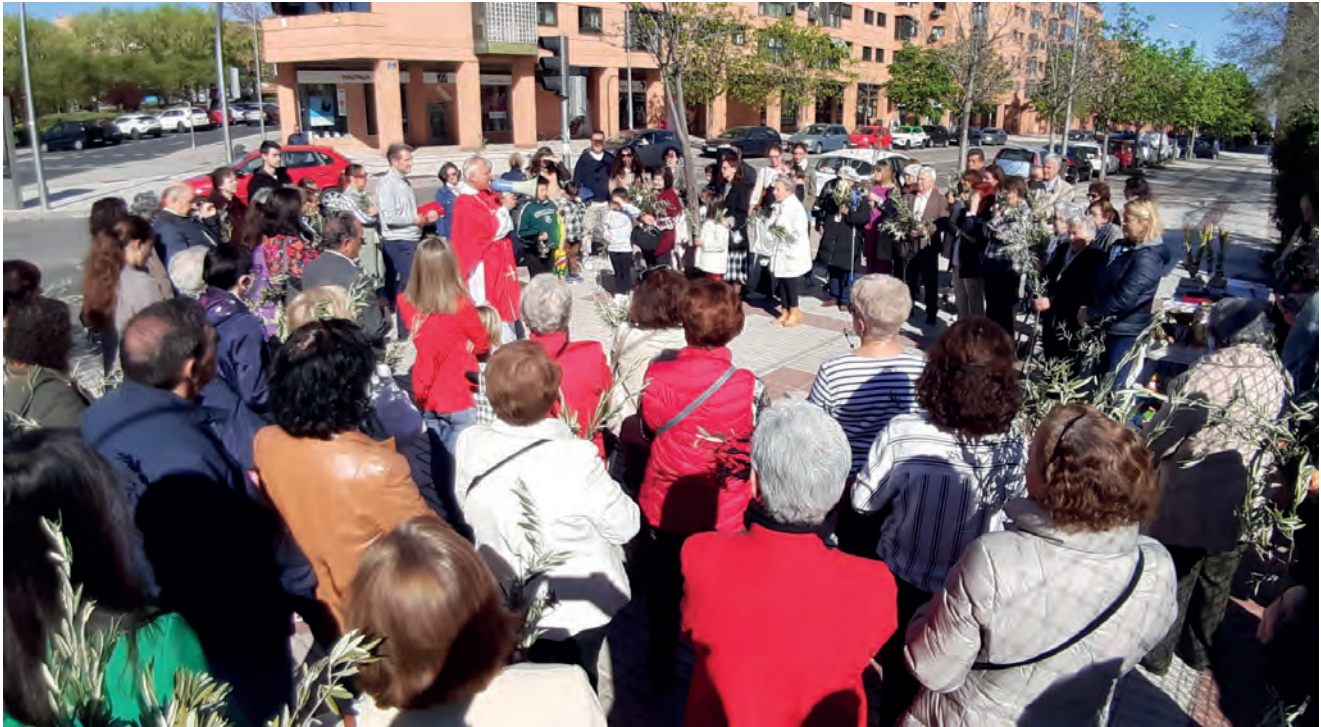
Celebración del Domingo de Ramos bendición y Procesión.