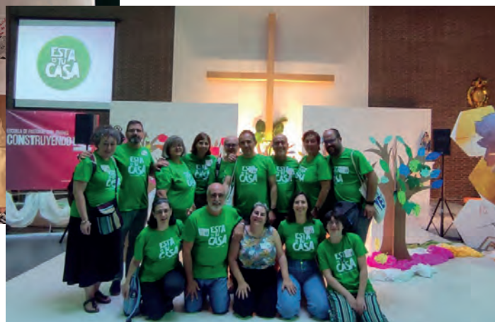
Hermanos y hermanas de las comunidades Adsis en la Escuela de pastoral con Jóvenes.