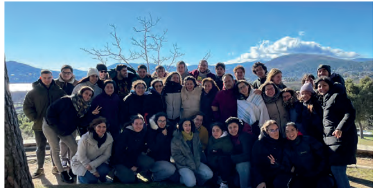
Convivencia de interioridad de comunidades juveniles en Navacerrada.