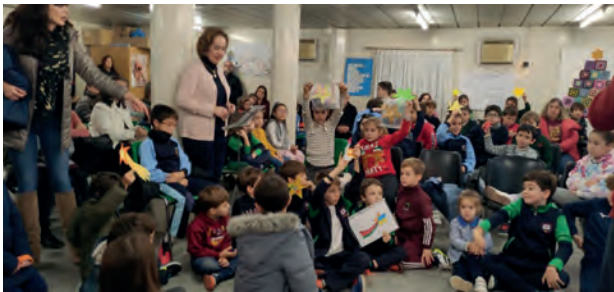
Niños y niñas de primero disfrutando del festival y con sus estrellas.