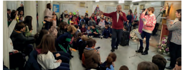
Entre villancico y villancico recordamos en familia el pasaje del nacimiento de Jesús.