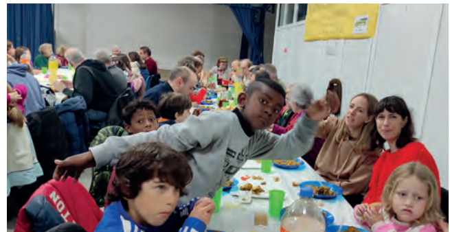
Los más peques disfrutando de la paella y pasta italiana.